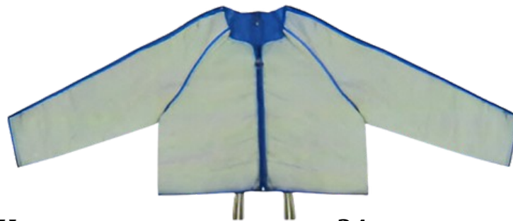
Куртка компрессионная 24-камерная (обхват живота до 134 см, обхват предплечий до 55 см)

Попеременное увеличение и снижение давления стимулирует активность лимфатической системы, что приводит к постепенному исчезновению отечности. Благодаря одновременной компрессии обеих конечностей, исключается возможность перемещения отечности в другую часть торса.