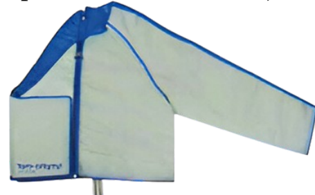
12-камерная правая половина компрессионной куртки (с болеро)