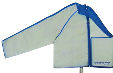
12-камерная левая половина компрессионной куртки (с болеро)