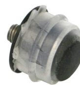
Насадка ручного аппликатора, диаметр 1,5 см