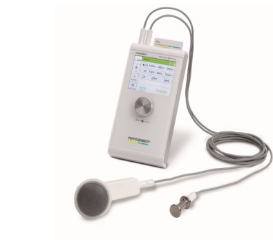
HIVAMAT 200 Personal