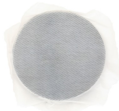
Комплект мембранный, диаметр 9,5 см (10 шт.)