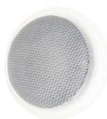
Насадка ручного аппликатора, диаметр 5 см