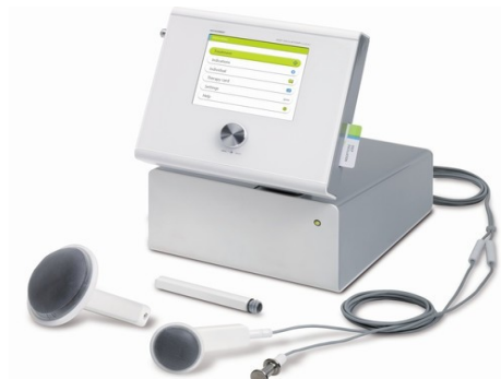
HIVAMAT 200 Evident