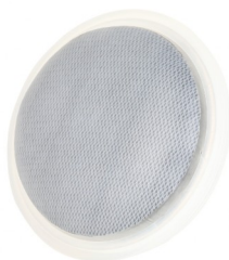
Насадка ручного аппликатора, диаметр 9,5 см