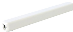
Рукоятка ручного аппликатора малая