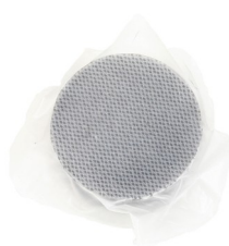
Комплект мембранный, диаметр 5 см (10 шт.)